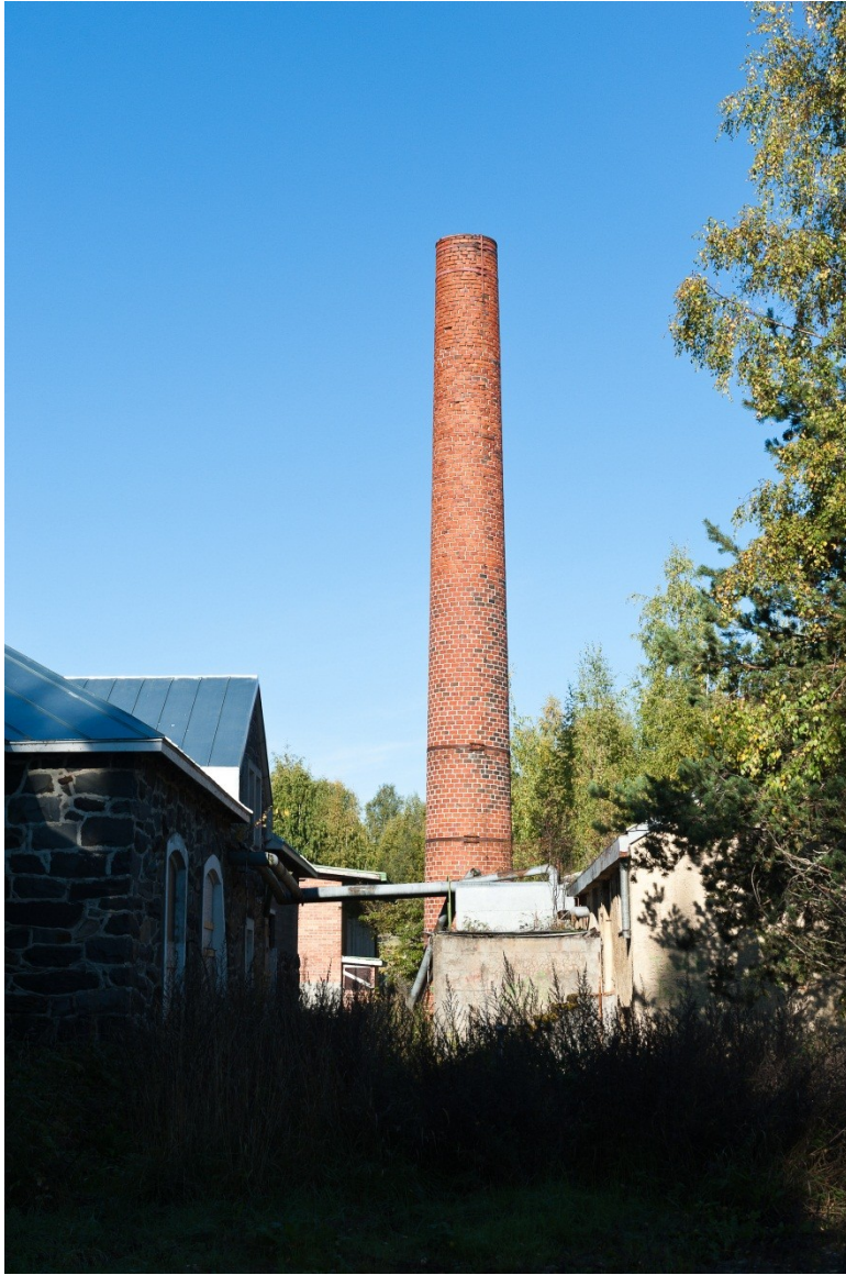
Kuva 5. Savupiippu on suojeltu