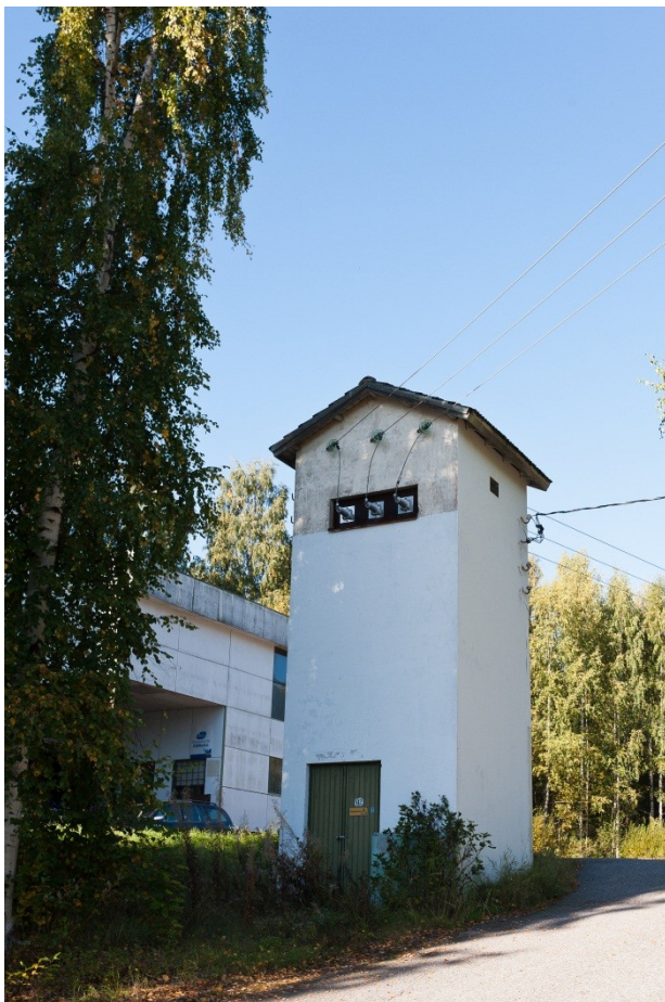
Kuva 9. Muuntaja