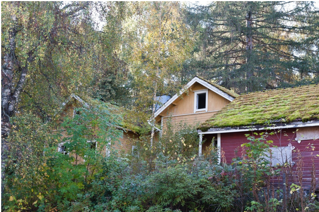
Kuva 11. Entinen isännöitsijän talo