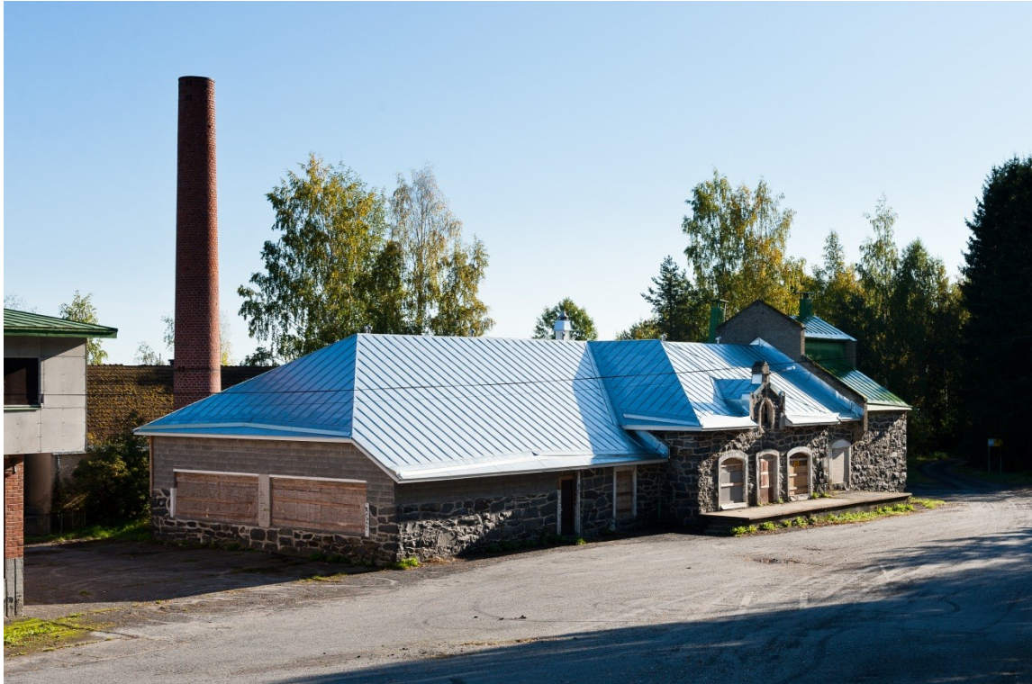
Kuva 3. Kivimeijeri on valmistunut 1907 ja laajennusosa 1928