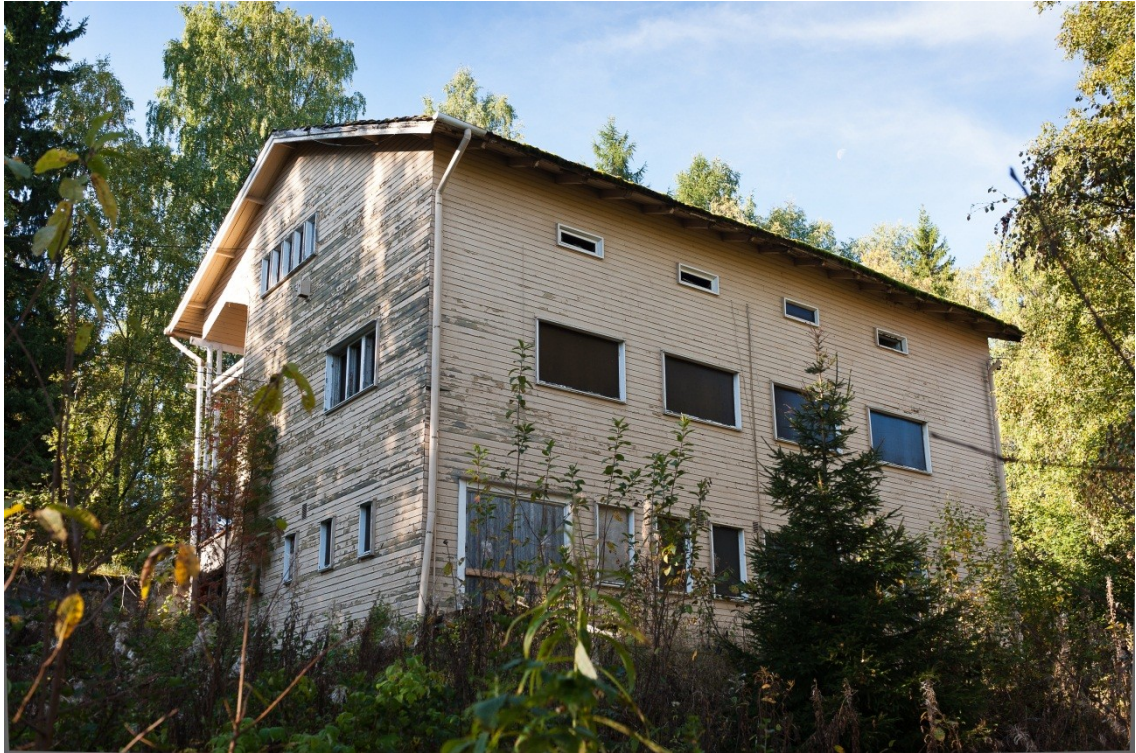
Kuva 10. Vanha konttorirakennus