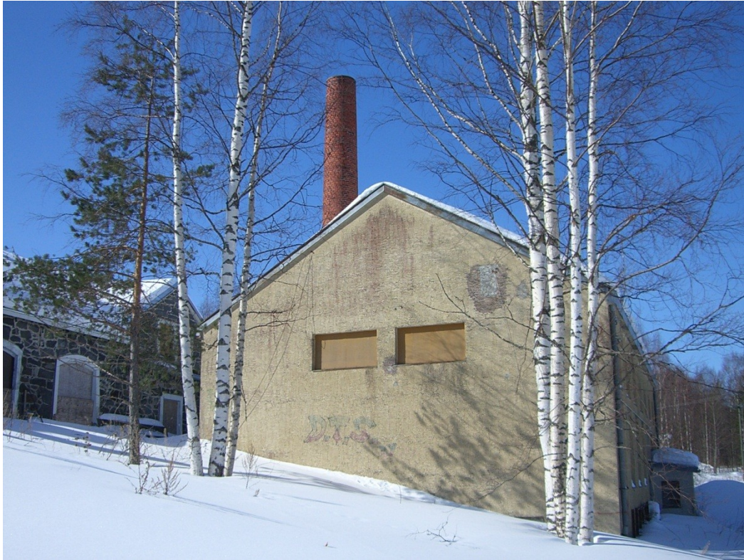
Kuva 6. Vanhassa konehuoneessa sijaitsee höyrykone, jolla on tuotettu Meijerin ja myllyn tarvitsema sähkö.