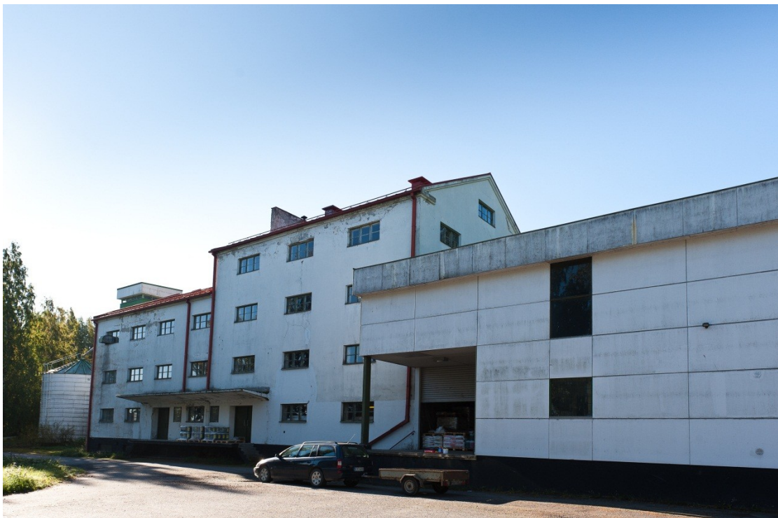
Kuva 4. Mylly on valmistunut 1940-luvulla, tasakattoinen varasto-osa on tehty 1970-luvulla