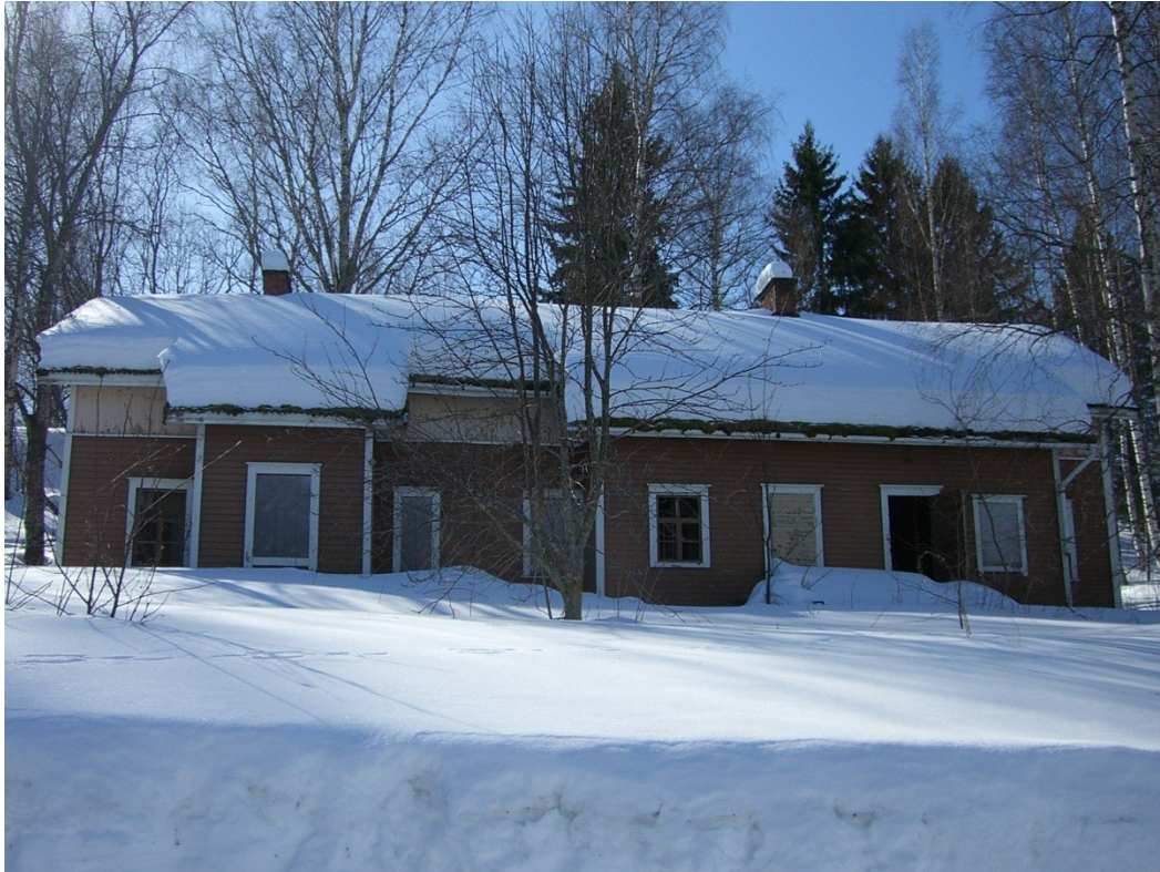
Kuva 12. Toinen vanhoista hirsirakennuksista on toiminut mm. myllyn asiakkaiden majoitustilana.