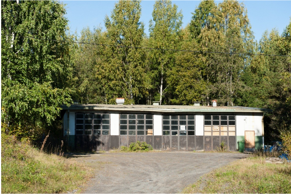
Kuva 8. Autotalli, joka toimii rakennusliikkeen varastona