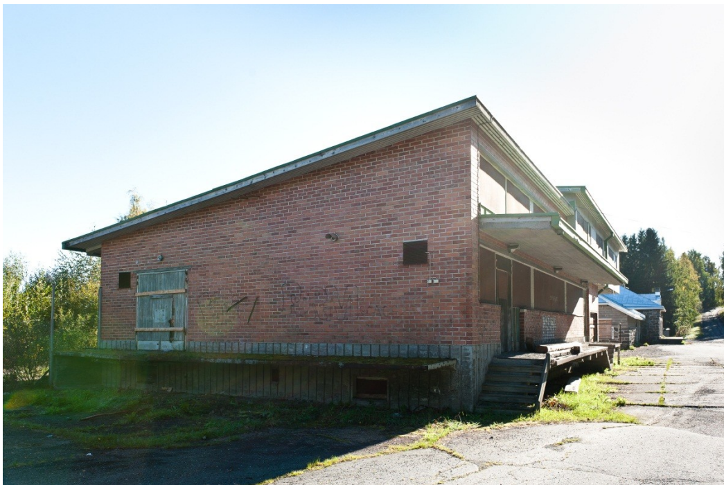
Kuva 7. Maidon vastaanottorakennus